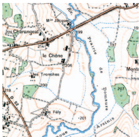
La carte IGN au 1:25 000, constamment remise à jour mais qui n'a rien d'exhaustif, identifie comme cours d'eau les tracés bleus, continus ou intermittents. Toutefois, cette présomption peut être infirmée ou confirmée par des constatations in situ.

L'entretien est nécessaire et obligatoire. Mais des opérations d'entretien mal adaptées peuvent entraîner des dommages difficilement réversibles pour le milieu aquatique et les propriétés riveraines. Par exemple, elle peuvent occasionner un recalibrage du cours d'eau, augmentant la vitesse des écoulements et aggravant les crues en aval, et causer des dégradations du milieu aquatique. Elles relèvent alors de l'aménagement.